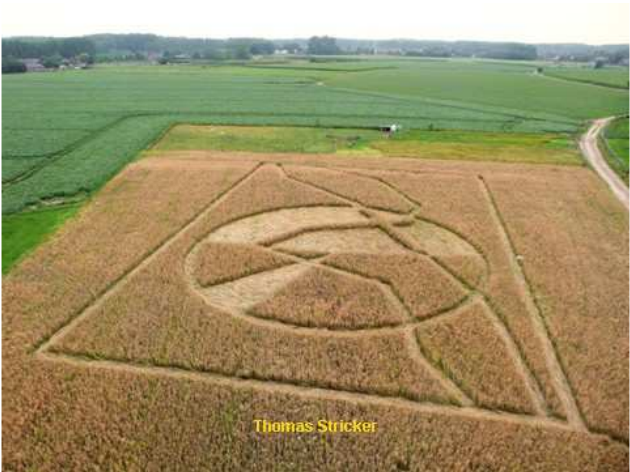
Landart, Thomas Stricker