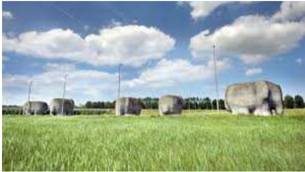
Mastodonten, Tom Claassen