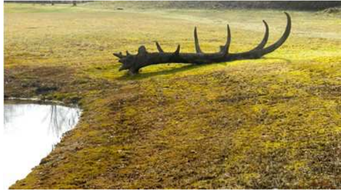
Gewei. Jan van IJzendoorn

Domein Oogenlust wil zich, binnen zijn territorium, richten op kunstwerken die op enigerlei wijze verwijzen naar de natuur. In dit deel van de route heeft het weinig zin om rustplekken of anderszins verblijfsplaatsen te creëren omdat die voorzieningen juist in Eersel en bij Oogenlust te vinden zijn. Wat wel aan te raden is, is een opvallend landmark te realiseren aan de overzijde van afslag 30 in de oksel van de A67 of wat verderop in een gebied dat direct aan de snelweg ligt. Deze markeringspunten, duidelijk vanaf de snelweg te zien, verwijzen direct naar het landelijke gebied.