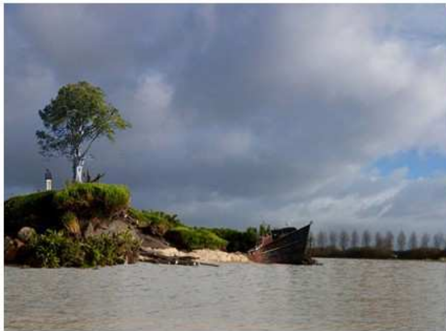
Een eiland, Jeroen Doorenweerd