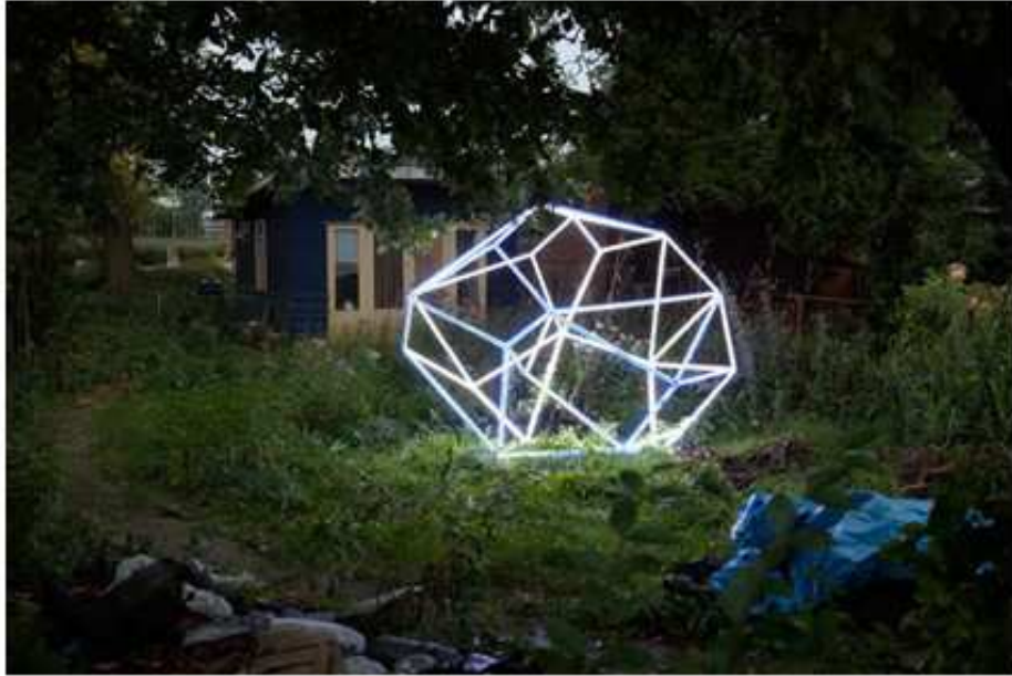
Lichtsculptuur, Herman Lamers