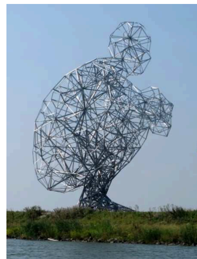
Zittende Man, Anthony Gormley

In het 'Masterplan Vrijtijdseconomie' spreekt de gemeente zich uit voor het ontwikkelen van nieuwe product-marktcombinaties op het gebied van kunst en cultuur. De omgevingskwaliteit van de dorpen spelen daarbij een belangrijke rol. Wandelpaden moeten mogelijkheden bieden om vanuit de dorpen via authentieke plekken het buitengebied in te wandelen, daarbij gebruik makend en aansluitend op bestaande routenetwerken.