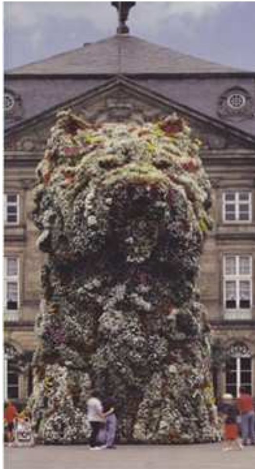
Puppy, Jeff Koons

Bij het vaststellen van de exacte route(s) wordt uitgegaan van de schoonheid van het landschap en de mogelijkheid om gebruik te maken van gebiedsdelen in eigendom van derden. Waar mogelijk worden de routes gevolgd zoals die te vinden zijn op de wandelkaart 'De Brabantse Kempen' van Falk uitgeverij. De mogelijkheden voor kunsttoepassingen zullen in een aparte vervolgotitie van bkcc worden uitgewerkt in concrete voorstellen.