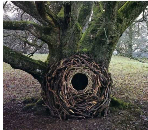
Nest, Andy Goldsworthy

Oogenlust wil in zijn directe omgeving een beeldentuin inrichten waarin kunst te zien is die op enigerlei wijze gerelateerd is aan natuur. Tevens behoort een aansprekend landmark, dat duidelijk vanaf de A67 zichtbaar zal zijn, tot het wensen pakket. "De ontwikkeling van het 15 hectare grote natuurgebied dat rondom het domein gelegen is, is gericht op de combinatie van natuur, recreatie en kunst die bezoekers als aantrekkelijk, verrassend en inspirerend ervaren, aldus een persbericht.