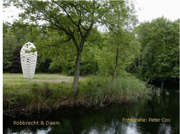
Duiventoren, Robbrecht & Daem